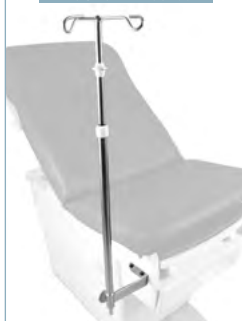
Tige porte-sérum IV pole