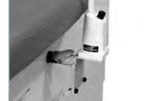
Support de fixation lampe Lamp support