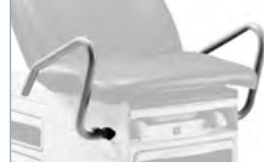
Paire de poignées d'assistance Pair of assist handles