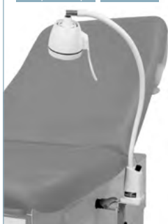
Se référer à la documentation Refer to the literature