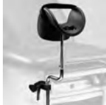
Appui-jambes Knee crutches