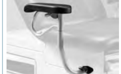
Paire d'appui-bras ajustables Pair of adjustable armrests